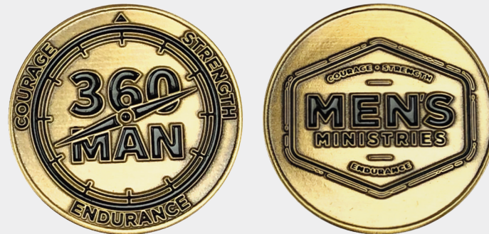
MONEDA DE DESAFÍO